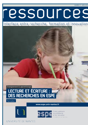
Lecture et écriture : des recherches en ESPE Avril 2018