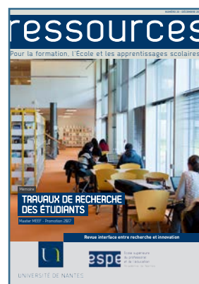
Travaux de recherche des étudiants de l'ESPE Décembre 2018