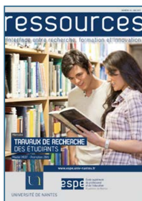
Travaux de recherche des étudiants de l'ESPE Session 2016

Cette revue interface entre recherche et innovation veut donner accès à la diversité d'approches scientifiques des recherches, des expérimentations menées en Inspé. Elle souhaite permettre aux chercheurs, formateurs, professionnels et étudiants de publier leurs travaux de recherche, d'innovation ou d'expérimentation.