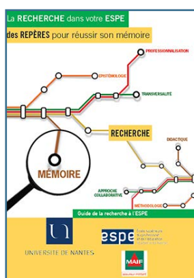
La recherche dans votre ESPE, des repères pour réussir son mémoire

Dans un format court et accessible, les livrets «Repères» exposent des connaissances et des réflexions sur des questions vives de la formation des enseignants. Les contributions de différents acteurs proposent trois types d'apports pour aider à se situer dans la formation : des repères sur les enjeux, des repères pour comprendre, des repères pour agir.